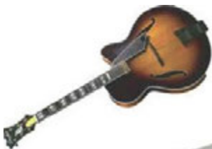
Guitar Amp (On Chair)